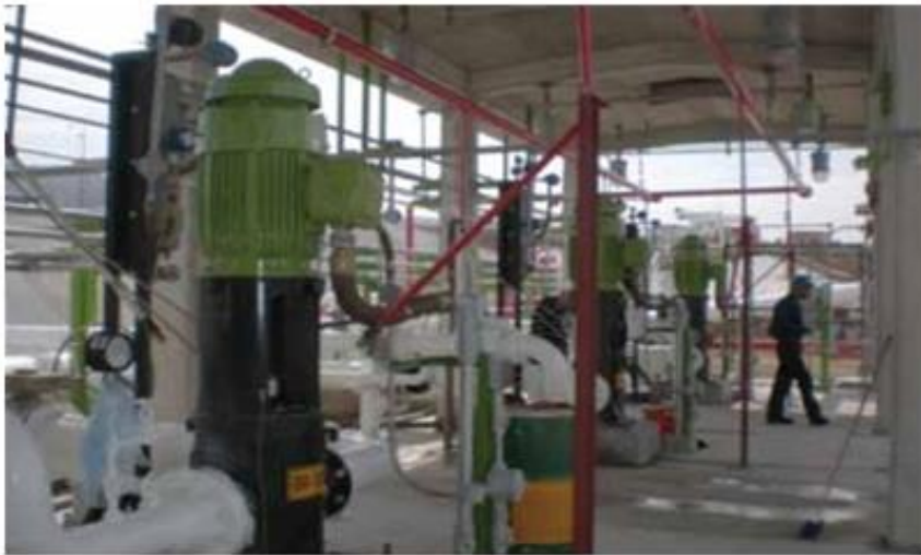
Figura 4. Sala de bombas.

La fluida colaboración entre diferentes actores (Cobra y Emerson) se dio durante la ejecución de la obra, las etapas de instalación, la puesta en marcha, y aun después.