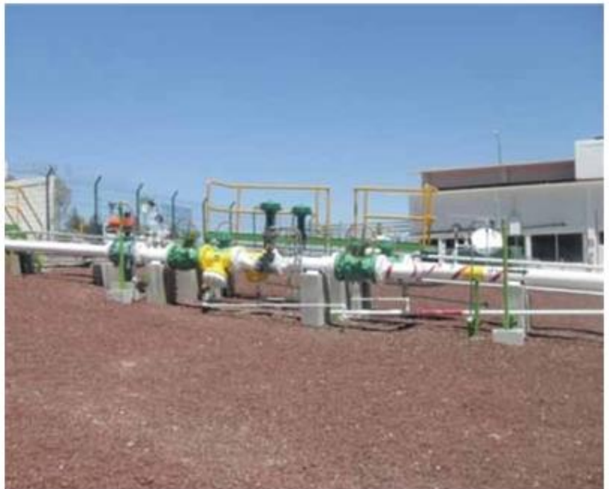
Figura 3. Recepción de Gas L.P. del gasoducto Cactus - Zapopan - Tula - Estación EB-04.

La implementación y puesta en marcha de la IRGE se realizó en 24 horas, luego de las cuales la planta alcanzó su capacidad de diseño de 20.000 bpd, con lo que cumplió los plazos y expectativas de producción previstas.