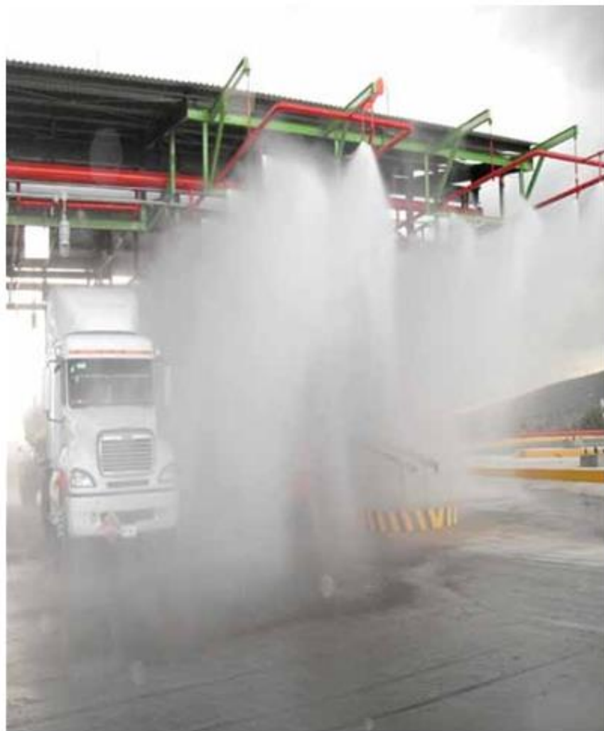
Figura 9. Zona de carga de autotanques.