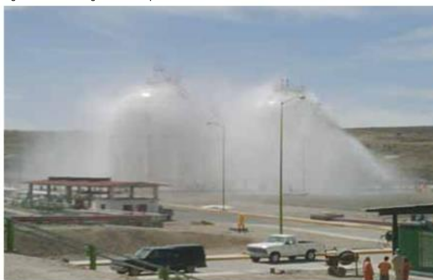
Figura 7. Esferas de almacenamiento.

a la hora de procurar la satisfacción de la creciente demanda.