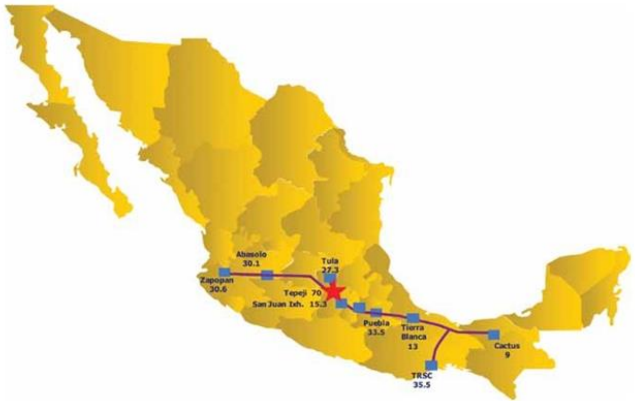
Figura 1. Ubicación del Gasoducto Cactus - Zapopan - Tula y de la IRGE de Gas L.P.

(en este caso Marsori Internacional de Negocios (O&M)), esta terminal pasa a ser una de las primeras en el país no operada por la estatal mexicana, situación que vale destacar a la hora de relatar el caso, ya que en las etapas iniciales del proceso esto fue motivo de preocupación máxima porque -valga también la puesta en contexto coyuntural- ello coincidió con un momento en que la legislación mexicana se estaba modificando para que empresas privadas pudieran dedicarse a la distribución y almacenamiento de GLP. Esto en su momento generó incertidumbre acerca de la futura integración entre los sistemas de Pemex Gas y Petroquímica Básica (PGPB) y la terminal IRGE.