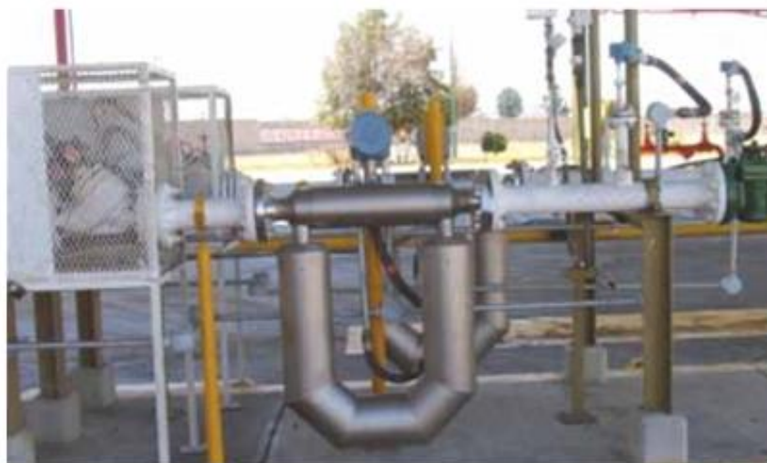
Figura 6. Zona de carga de autotanques.