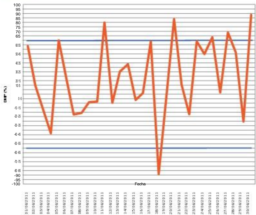
Figura 5. Control chart.

La IRGE realizó este mismo proceso en la mitad de tiempo, y con un error menor a 1 kg, lo que permitió una capacidad de llenado de hasta 160 camiones/día en sus 10 islas de llenado. Esto representó 40 camiones más por día que plantas similares, transformando a la Terminal de Atonilco en una de las plantas que, según los expertos, es una de las más eficientes de la región, y también de las más concurridas de la zona mexicana